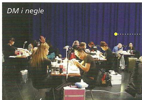
DM i negle

Traditionen tro afholdt Dansk Kosmetologforening sin årlige messe, Beauty 13, i marts, og Fagbladet Kosmetik besøgte naturligvis messen. Vi bringer en reportage: